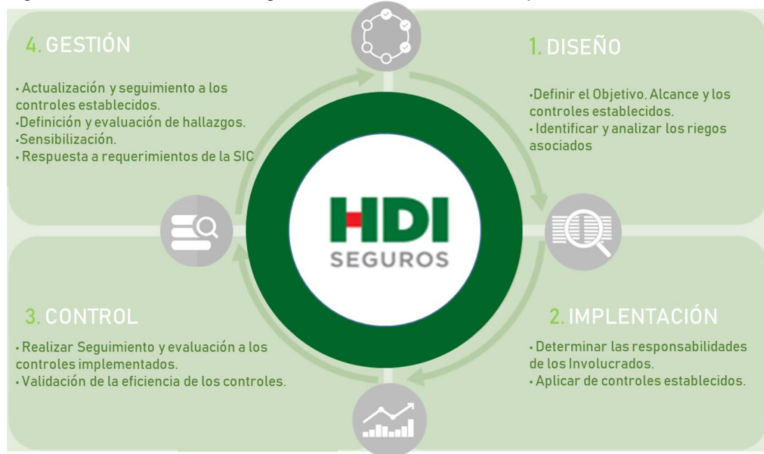
Figura1. Ciclo Continuo del Programa de Protección de Datos personales